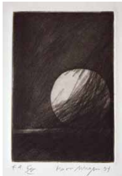
Mario Schosser, „Druckwerk“, Plattengröße 14,5 x 9,7 cm, Aquatinta/Kaltnadel auf Zerkall 250 g/qm.

Die Ausstellung wurde von der Firma Communicate unterstützt.