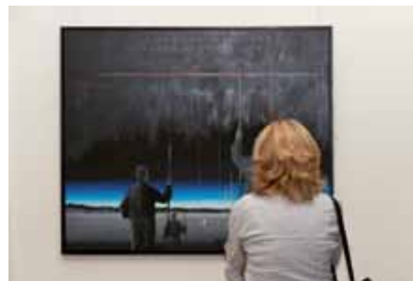
Besucherin vor dem Werk von Ulrich Köditz

denn beim Bildtitel liest er entsetzt: „Ohne Titel“. Acryl auf Leinwand, 2010. Na prima, jetzt kenne ich wenigstens das Material und weiß, dass der Künstler auch im letzten Jahr kreativ war. Ist es vielleicht nur Dekorationskunst? Aber warum nur? Hat dekorative Kunst keine Existenzberechtigung, weil ihr die politische, gesellschaftskritische oder tiefenpsychologische Aussage fehlt? Ist ihr Käufer ein verachtenswerter Banause, weil er findet, dass das Bild gut zu seinem Sofa oder in seine Arztpraxis passt? Was will uns der Künstler damit sagen? In einigen Fällen sagen Künstler sehr viel über ihr Werk, gipfelt es in regelrechten Interpretationsüberfrachtungen. Beschreibungen, die auch mal als intellektueller Push Up für recht banale Kunst dienen können. 6 Gartenzwerge stehen auf Rollrasen rum. Im Schrebergarten pure Spießigkeit – im Museum eine ironische Demaskierung der Idylle, ein zwanghaftes sich Fügen in Vermeidbares ohne die normative Kraft der Individualisierung im gesellschaftlichen Spannungsfeld zwischen Anpassung und Rebellion. Und weit und breit kein Künstler, mit dem ich diskutieren kann.