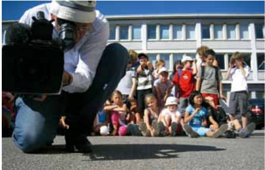
Klasse 4a der Grundschule am Jagdfeld in Haar bei Filmaufnahmen des Bayerischen Rundfunk im Atelier, 2010

Die Voraussetzung an der Teilnahme ist die Professionalität. Diese muss auch unsere Grundlage sein, wenn wir mit Schulen und Institutionen zusammen arbeiten. So können wir klarstellen, dass wir nicht als Niedriglohnpädagogen einsetzbar sind oder den Verlust von kreativen Fächern im Schulbereich ausgleichen. Unsere Qualität ist die Phantasie, das Experiment und die Visionen. Die können wir nur weitervermitteln, wenn uns dazu der Freiraum gegeben wird. Stimmen diese Parameter, dann können wir unseren Beitrag als Künstler zu einem Gleichgewicht zwischen einer rein Wissenschafts-, Wirtschafts-, Geld-geil-orientierten Gesellschaft und einer kritikfähigen Wahrnehmungsgesellschaft leisten. Um dieses Angebot sichtbar zu machen, hat sich der Landesverband entschieden, eine bayernweite Webseite „Schule und Kunst“ aufzubauen. Sie ist vergleichbar mit der Künstlerdatenbank, ist aber ausschließlich für künstlerische Projekte mit Schulen, Schülern, Institutionen jedweder Art gedacht, aber auch für Schulen oder Institutionen, die Projekte planen. Die Künstlerseite enthält somit die Suchmöglichkeit nach KünstlerInnen, gegliedert in die Regierungsbezirke. Dies gilt analog für die Seiten Schule und Projekte. Die drei Einheiten – Schulen, Künstler, Projekte – sollen