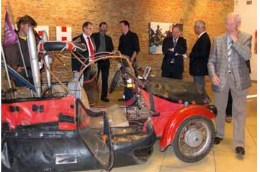
Christian Schnurer „Argonaut Mathilda“, Amphibienfahrzeug – siehe auch „im Bilde“ 1/2011, S. 13