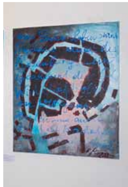
Eine Arbeit von Renate Moran im Ausstellungsraum der Galerie Hajek in Prachatice.

Wir freuen uns, dass die Bayerische Staatsgemäldesammlung einige Kunstwerke aus der Ausstellung angekauft hat.